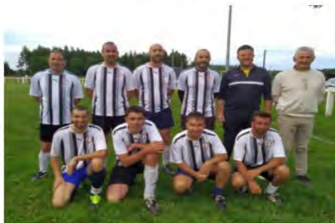
Equipe des vétérans