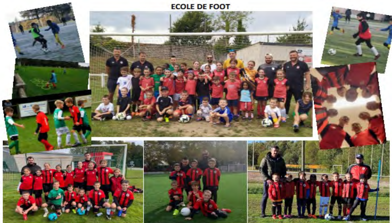
U 11 / U13